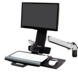
Brazo combinado para trabajar de pie o sentado StyleView