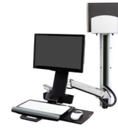
Sistema combinado para trabajar de pie o sentado StyleView