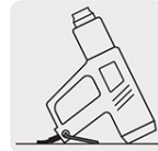
Soporte de descanso