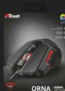
PACKAGE FRONT 1