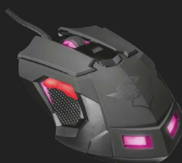
PRODUCT VISUAL 2