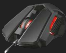
PRODUCT VISUAL 5