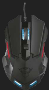
PRODUCT TOP 1