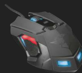
PRODUCT VISUAL 3