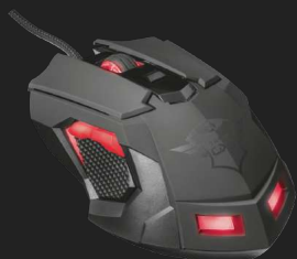
PRODUCT VISUAL 1