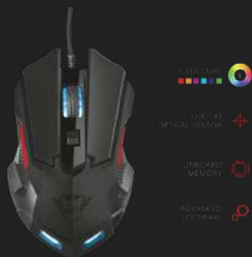
PRODUCT ESHOT 1