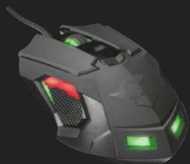
PRODUCT VISUAL 4