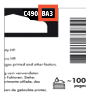
Opción de idioma