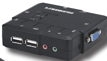
Model 151252: 2-Port

ENGLISH DEUTSCH ESPAÑOL FRANÇAIS POLSKI ITALIANO