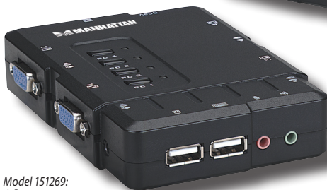
Model 151269: 4-Port