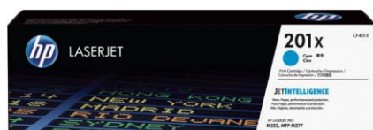
Cartuchos de tóner originales HP con JetIntelligence

Los cartuchos de tóner originales HP con JetIntelligence proporcionan a su empresa más páginas 3 , máximo rendimiento de impresión y la protección adicional que ofrece la tecnología antifraude: nuestros competidores simplemente no pueden igualarlo.