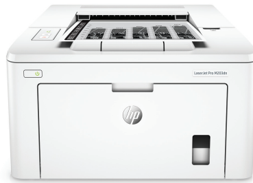
Impresora HP LaserJet Pro M203dn

Obtenga más páginas, rendimiento y protección 1 de una impresora HP LaserJet Pro sin cables alimentada por cartuchos de tóner JetIntelligence. Establezca un ritmo más rápido para su empresa: gestione con facilidad para maximizar la eficiencia e imprima documentos a doble cara de forma instantánea.