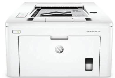
Impresora HP LaserJet Pro M203dw