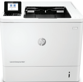
HP LaserJet Enterprise M607dn