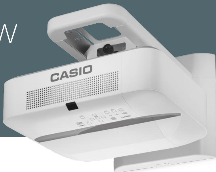
Montaje en pared YM-80: opcional