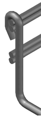
Peralte 54 mm