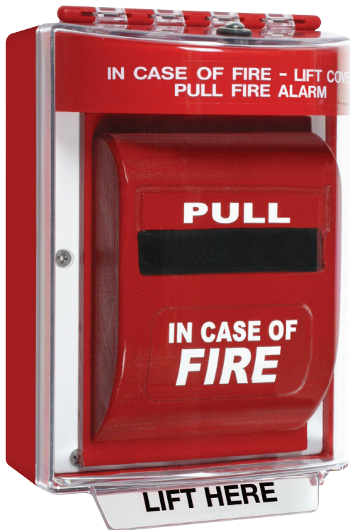
Mostrado con caja a prueba de agua