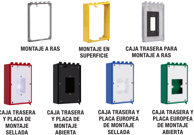
MONTAJE A RAS