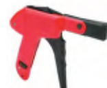
Herramienta de Sujeción de Cintillo de cable estándar

Usar para ajustar cintillo de cable en un objeto