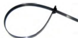
Cintillo de Cable de una Correa Extra Grande

Part #: RS7055C 100/pk Part #: RS7055M 1000/pk