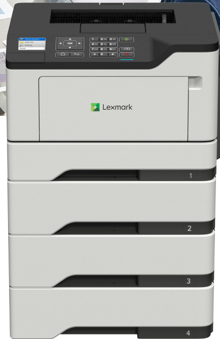
MS521dn con bandejas opcionales

Confiabilidad. Seguridad. Productividad.