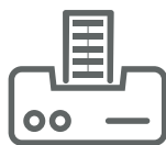
IMPRESIÓN TÉRMICA DIRECTA