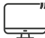
PANTALLA 15" (38.1 cm)