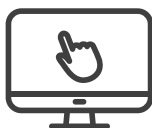
PANTALLA TÁCTIL CAPACITIVA