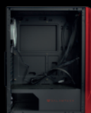
8 ESPACIOS PARA VENTILADORES

Con espacio para 8 ventiladores Cyclops iluminará todo hacia su cara frontal en una imagen digna de presenciar: El ojo que todo lo ve. Cuenta con 4 bahías para discos duros, 7 ranuras de expansión PCI, soporte para enfriamiento líquido y filtro superior magnético para evitar la entrada de polvo pero propiciar un flujo de aire digno de un gabinete Balam Rush.