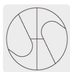
Punta Split Point