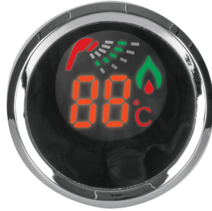
Display digital para indicar temperatura