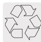
El cobre es un material reciclable