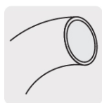
Tubos flexibles para presión baja y alta