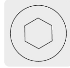
Entrada para llave allen