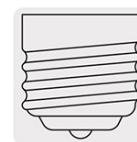
Base Mogul E39