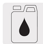
Incluye un bote de 250 ml de aceite monogrado SAE30