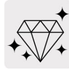
Banda de diamante