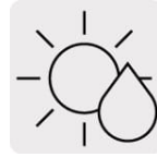
Corte en seco o en húmedo