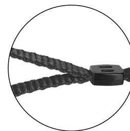
Correa de tela