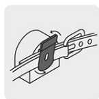
Clip para mejor sujeción