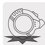
Resistente a impactos