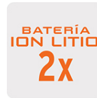
Más tiempo de vida Mayor velocidad de carga