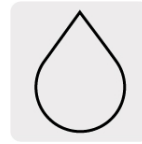
Para cortes en húmedo