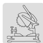
Para sierra de inglete