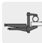
Tipo de sujeción