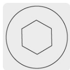
Entrada para llave allen