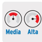
Funciona con presión