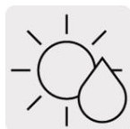
Corte en seco o en húmedo