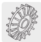
Impulsor de latón