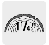
Capacidad de corte