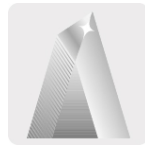
DIENTES CON TRIPLE FILO para cortes más rápidos