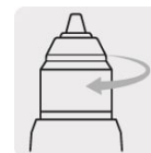
Broquero sin llave