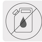
Libre de mantenimiento por cambio de aceite