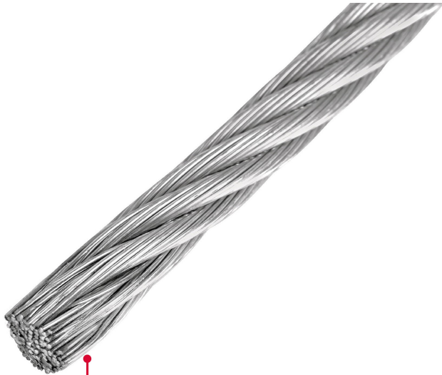
Acero acabado galvanizado