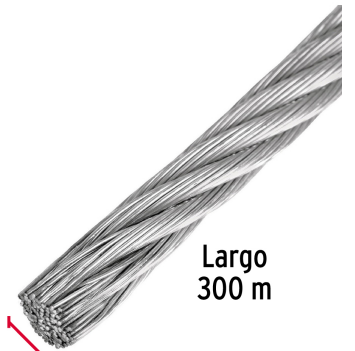
Largo 300 m