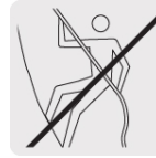
No usar para escalar