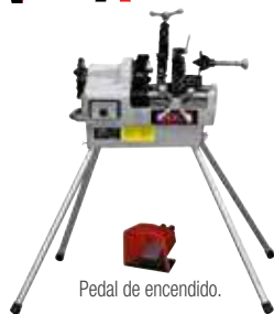
Pedal de encendido.