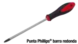
Punta Phillips® barra redonda