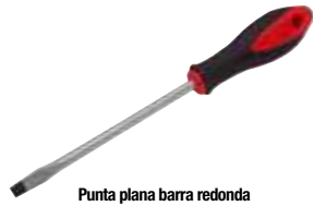
Punta plana barra redonda