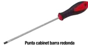
Punta cabinet barra redonda