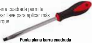
Punta plana barra cuadrada