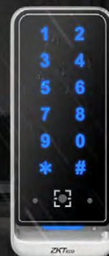
QR600 - VK