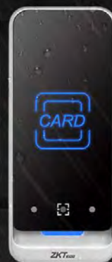
QR600 - V