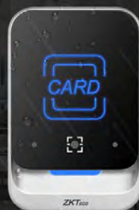
QR600 - H