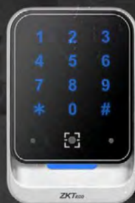
QR600 - HK