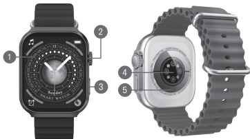
DIAGRAMA DE PRODUCTO