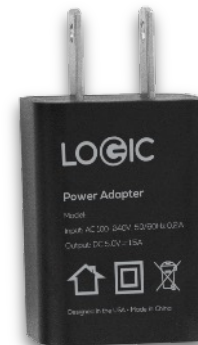
CARGADOR DE PARED