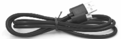
USB 2.0 Type C