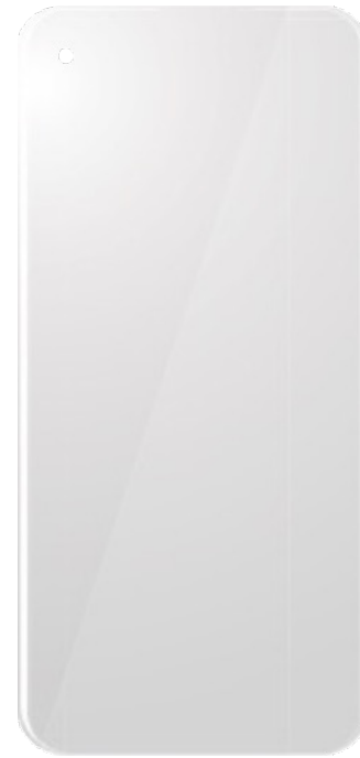
PROTECTOR DE PANTALLA DE VIDRIO TEMPLADO