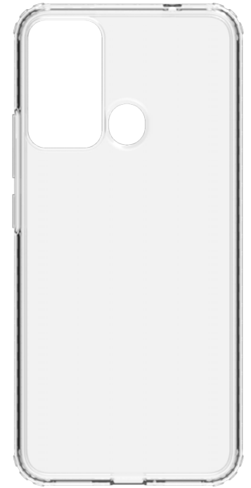
ESTUCHE DE SILICONA