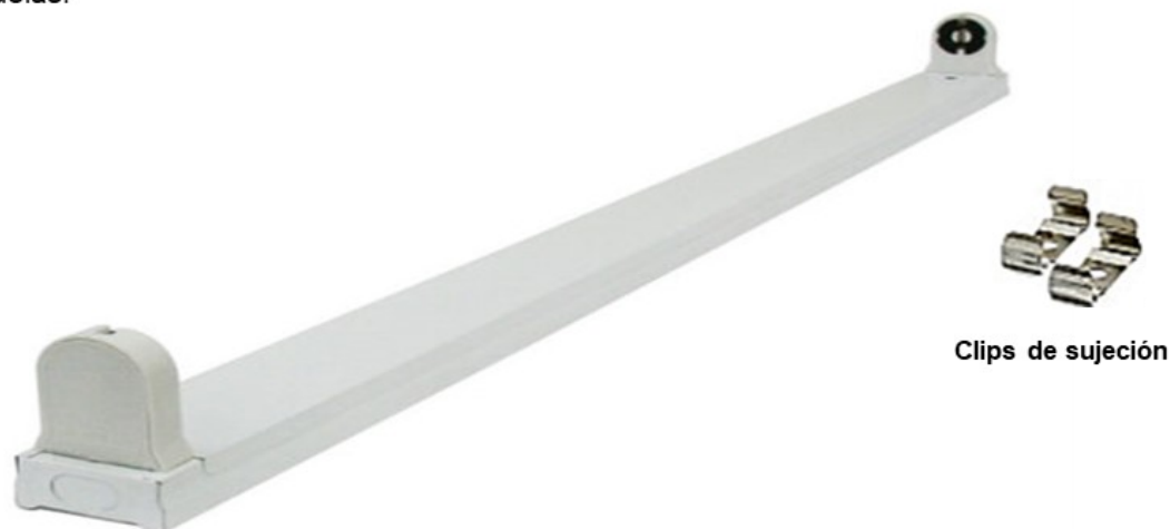
Clips de sujeción