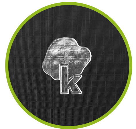
Detalle de imagotipo