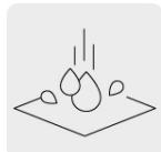
Resistentes al agua