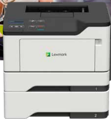
B2442dw con bandeja opcional