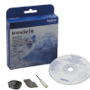
Bobbin work. (Se vende por separado).