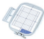
Aro SA439 de 13x18 cm.