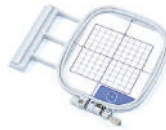
Aro SA438 de 10x10cm. (Se vende por separado).