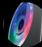
4 VENTILADORES ARGB INCLUIDOS