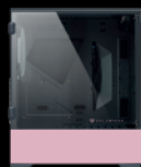
PANEL DE CRISTAL TEMPLADO