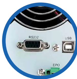
Puertos de comunicación