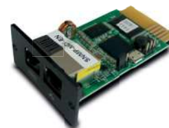
Tarjeta opcional: EMD (Dispositivo de monitoreo ambiental)