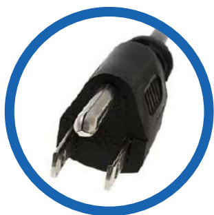
Cable de alimentación CA NEMA 5-15P