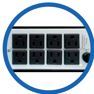
8 terminales NEMA 5-15R, de los cuales 4 son programables