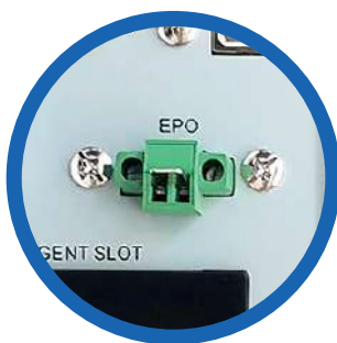
Apagado de emergencia (EPO)