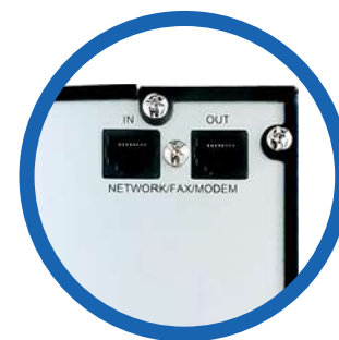
Protección de línea de datos