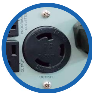
Terminal de salida NEMA L5-30R