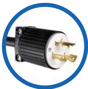
Cable de alimentación CA NEMA L5-30P