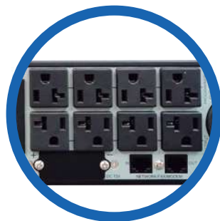
8 terminales NEMA 5-20R, de los cuales 4 son programables