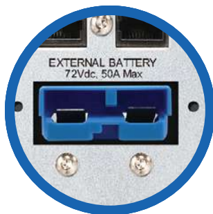
Entrada banco de baterías externas