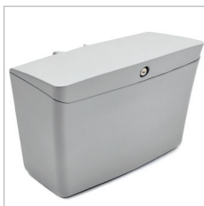
CAJÓN DE ALMACENAMIENTO SV