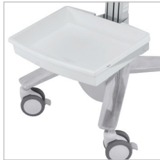
BANDEJA FRONTAL SV