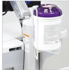
SOPORTE PARA TOALLITAS DESINFECTANTES SV