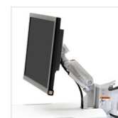
BRAZO PARA LCD