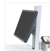
PIVOTE PARA LCD