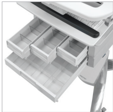
VARIAS CONFIGURACIONES DEL CAJÓN