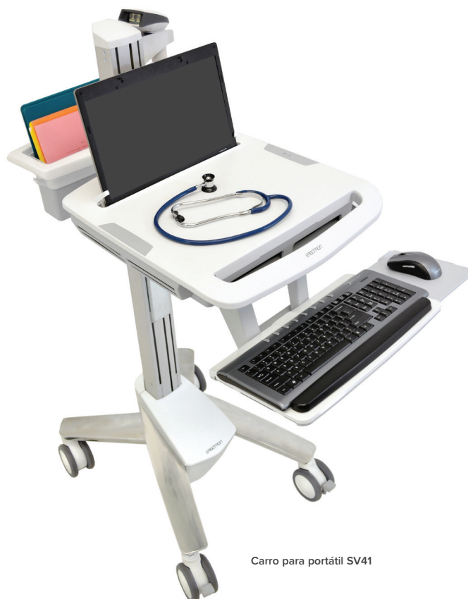
Carro para portátil SV41